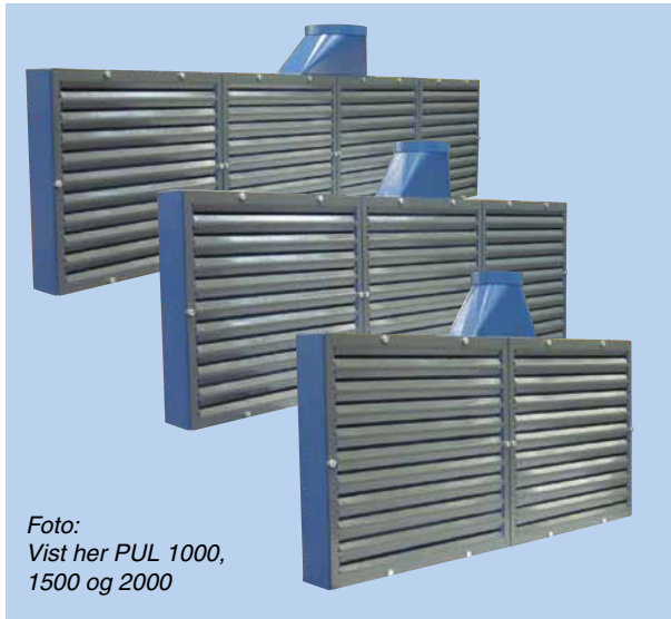
Foto: Vist her PUL 1000, 1500 og 2000